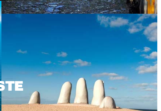
PUNTA DEL ESTE