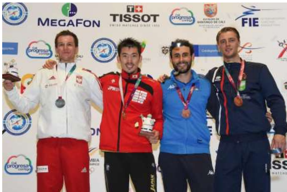
Grand Prix 2019 Cali Centro de eventos Valle del Pacífico