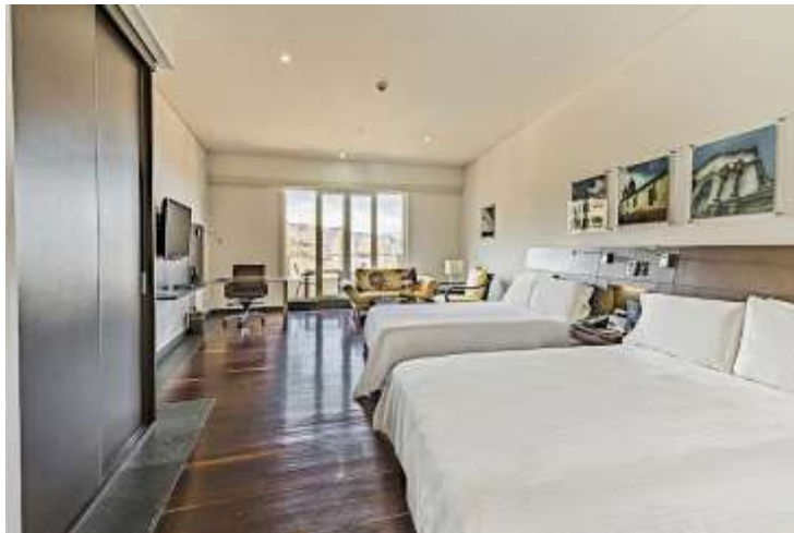
Luxury King- twin suites with balcon hotel spi