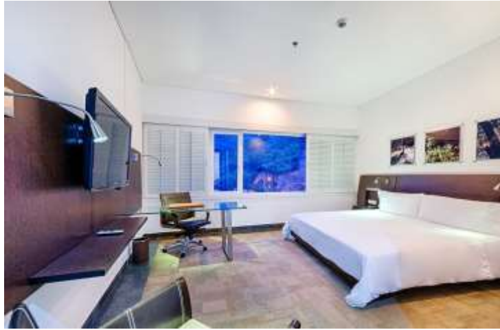
Master suite hotel spiwak