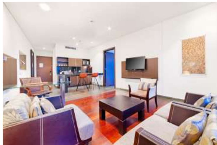
Super Master Suite