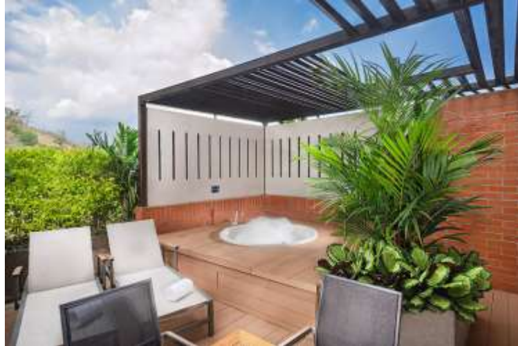
Luxury King- twin suite with jacuzzi Hotel Spiwak