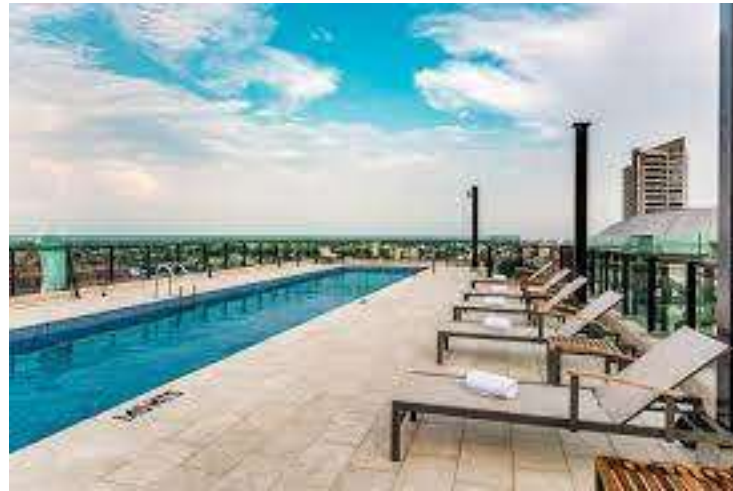
Luxury King- twin suite Hotel Spirito