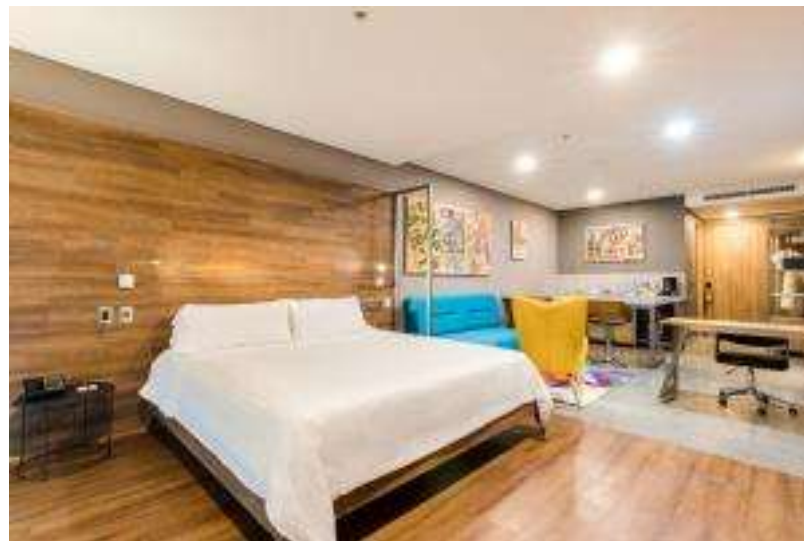
Master Suite Hotel Spirito