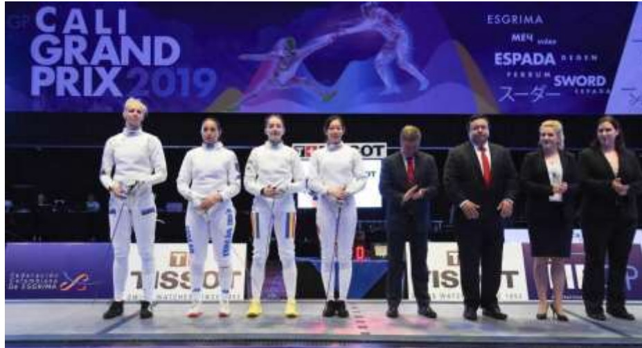
Grand Prix 2019 Cali Centro de eventos Valle del Pacífico