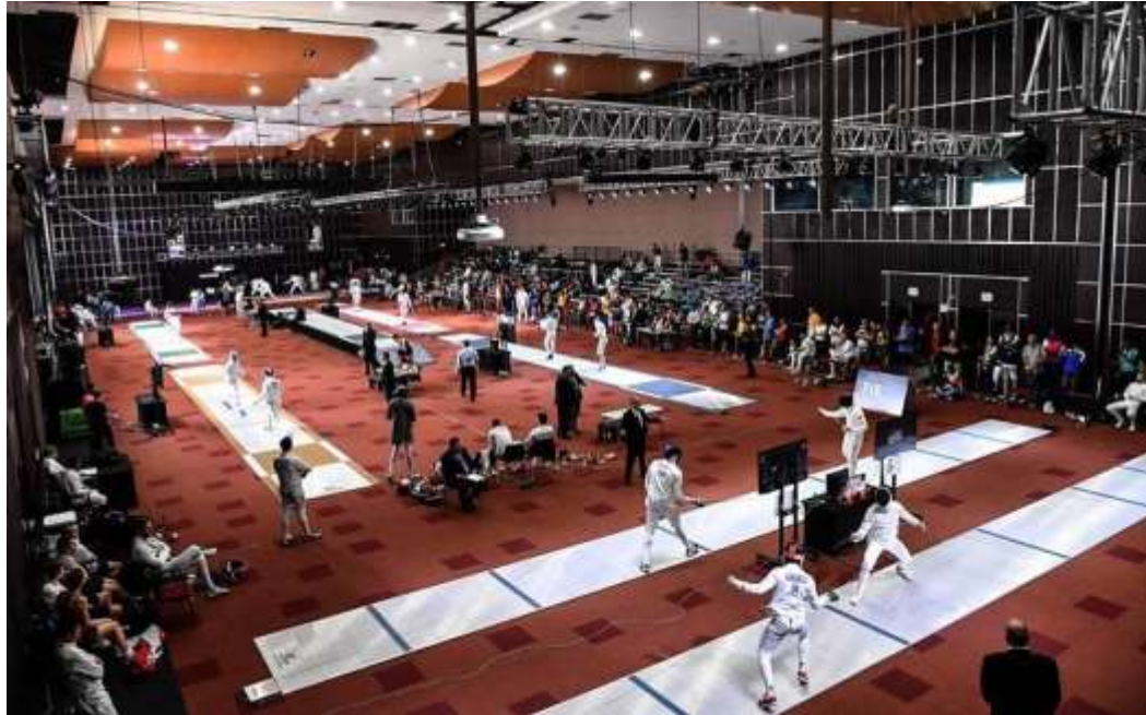
Vista General de la competencia en el Centro de Eventos