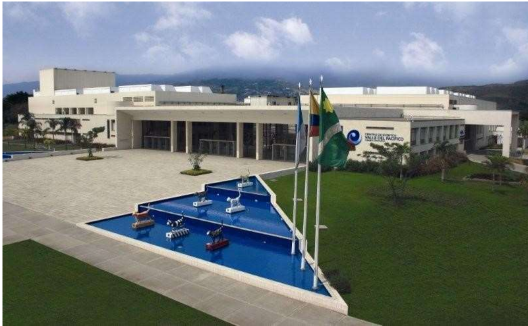
Vista general del Centro de Eventos Valle del Pacífico

📍 Dirección: Calle 15 No. 26-120 Arroyo Hondo, Hno. Trinidad Etapa 1, Yumbo, Valle del Cauca